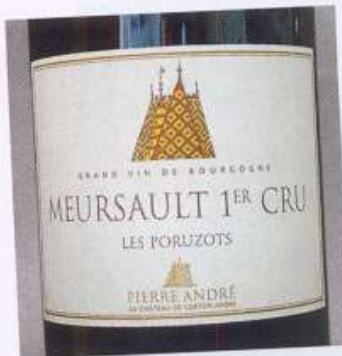
Meursault 1er cru